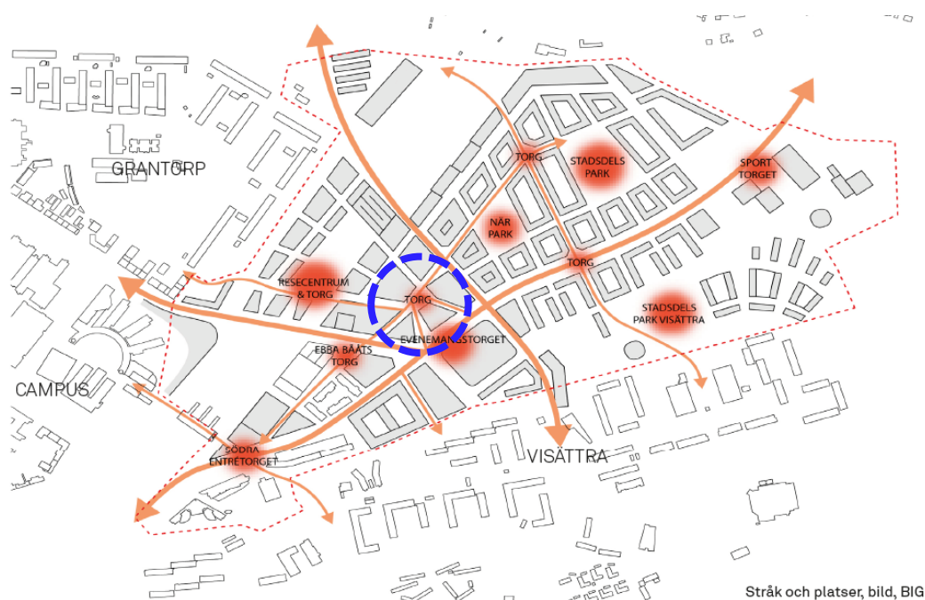
Stråk och platser, bild, BIG

Viktiga stråk och platser pekas ut och genom det aktuella planområdet löper flera av de prioriterade stråken. Stadscentrums stråk bidrar till att knyta samman Flemingsbergs olika delar och skapa tydliga kopplingar till centrum och olika målpunkter. Inom planområdet pekas också ett torg ut.